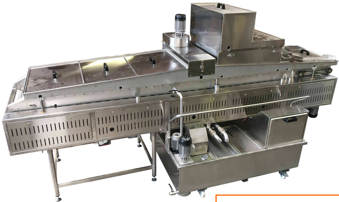
In figura Modello ARACHIDI-300