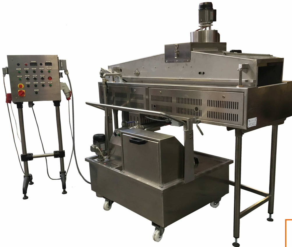
In figura Modello Pellets 70